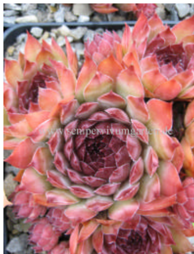
Sempervivum Summer Music

Wieder eine wüchsige Hybride von Carlo De Wilde, mit besonders schöner Sommerfärbung! Ausverkauft!