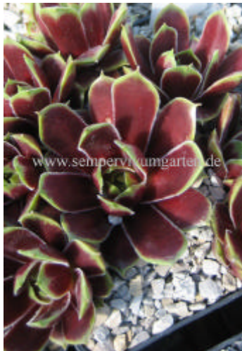
Sempervivum Schutz Hybrid

Schutz Hybrid Leider ohne genaue Herkunft Eine Pflanze ohne genauer Herkunft. Habe ich auch schon unter anderem Namen gesehen! Super! Ausverkauft!