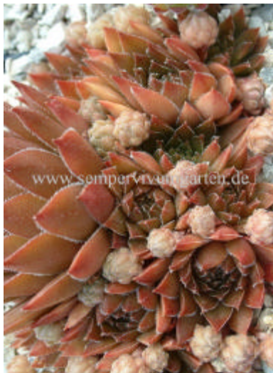
Sempervivum Old Rose