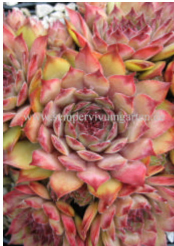
Sempervivum Trail Walkers