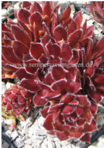
Sempervivum Deep Fire

Die perfekt geformten Rosetten fallen auf. Ein Elternteil soll S. tectorum ‚Atropurpureum‘ sein. Ausverkauft!