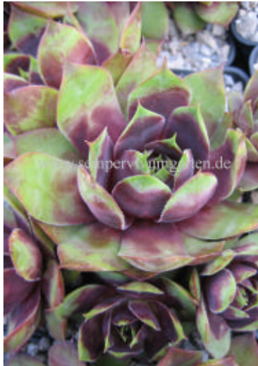
Sempervivum Night Raven