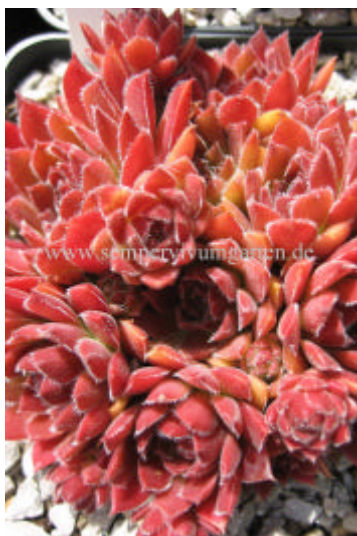
Sempervivum Havendijker Teufel