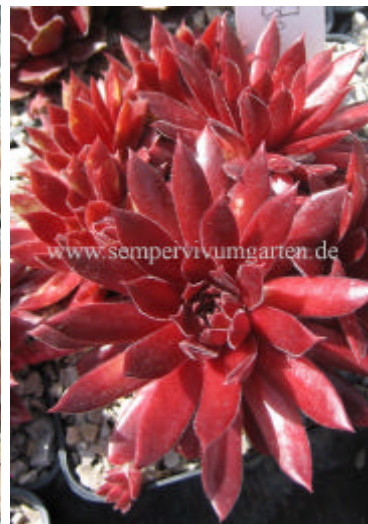
Sempervivum Pazific Blazing Star