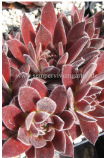
Sempervivum Pazifik Sexy

Old Rose Kevin Vaughn USA 1962 Ein kleinere Sorte, die dichte Polster bildet und durch die Färbung auffällt! Sehr gute Kombination zu allen Farben! Besonders interessant in Kombination mit weißen Spinnweb-Hauswurz! Ausverkauft!