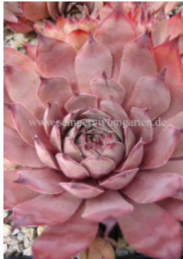
Sempervivum Pink Astrid