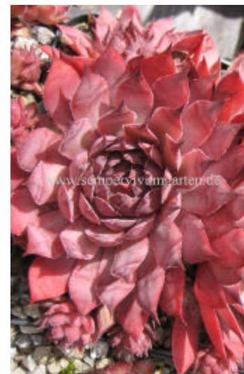
Sempervivum Dark Cloud