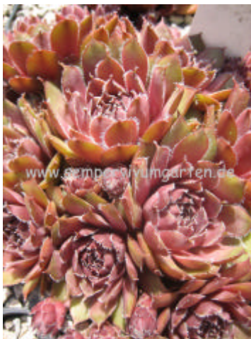
Sempervivum Red Elf