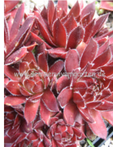
Sempervivum Havendijk's Red

Dyke David Ford GB 1984 Hier haben wir eine kleinere Sorte. Das Rosettenzentrum ist kräftig gefärbt, nach außen wird die Farbe heller. Sprosst willig!