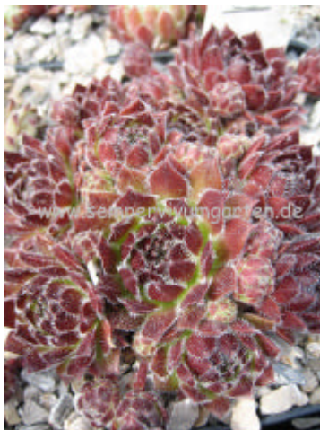
Sempervivum Princess Astrid

Eine kleine Pflanze, die sich kräftig vermehrt und so schnell kleine Polster bildet. Gut zu erkennen ist auch die Abstammung von Sempervivum arachnoideum.