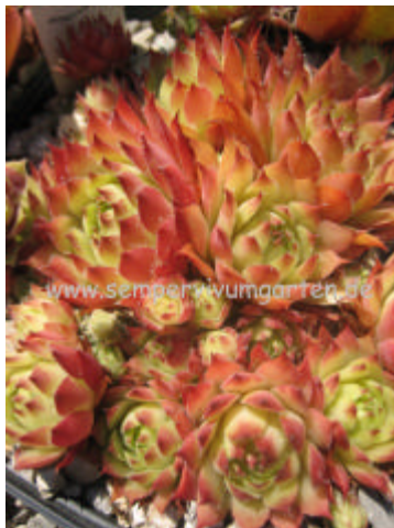
Sempervivum Winter Beauty

Eine sehr kleine Kreuzung, die kräftig sprosst und so ganz dichte Polster bildet. Die Farben sind rund ums Jahr auffallend.