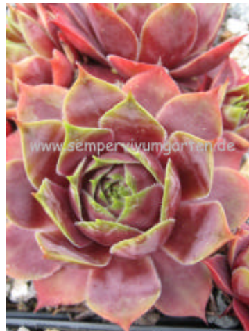
Sempervivum Tiger Baby