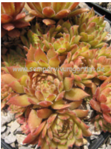
Sempervivum Hit Parade

Havendijker's Red Carlo K. J. De Wilde NL 2002 Eine gleichmäßig gefärbte Sorte, die auch im Sommer ihre Farbe gut hält. An den Blatträndern zeigt die Pflanze eine leichte weiße Behaarung.