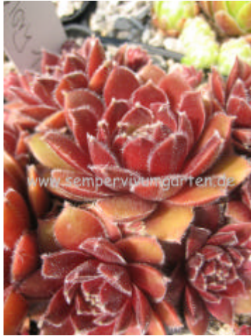
Semperv. Lennik's Glory No 1

Hier haben wir eine ältere Kreuzung! Eine kleine wüchsige Pflanze, mit kräftiger Färbung.