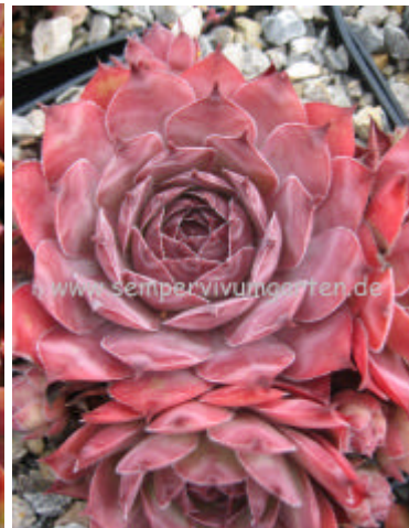
Sempervivum Pacific Thunder