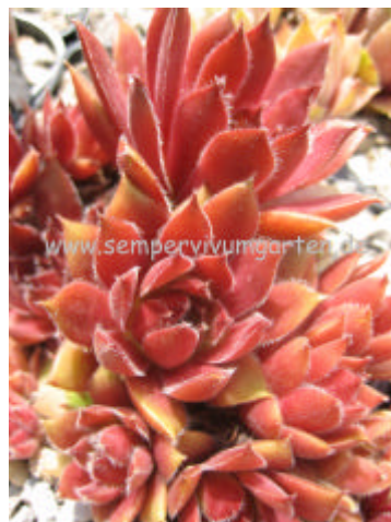
Sempervivum Jeanne D'Arc