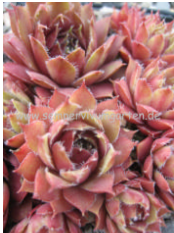
Sempervivum Spring Mist