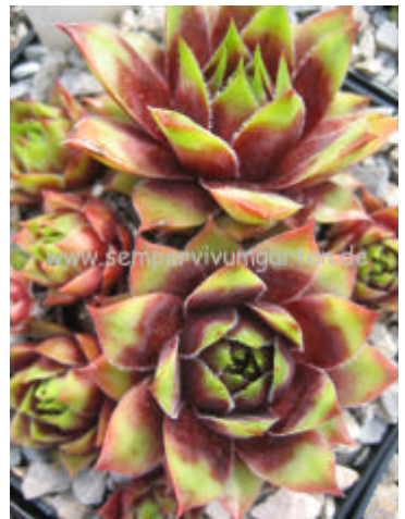
Sempervivum Drama Girl