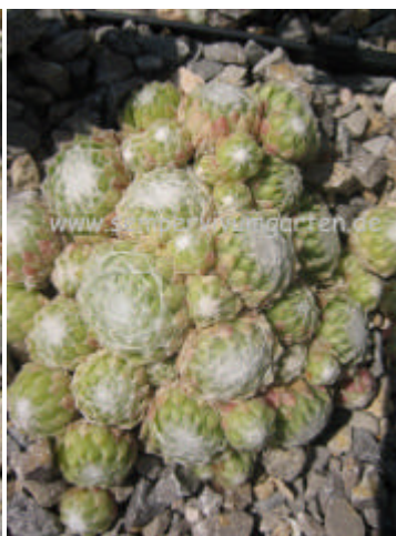
Sempervivum Zilver Barones