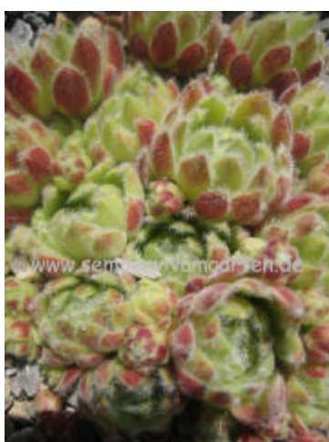
Sempervivum Zilver Rose