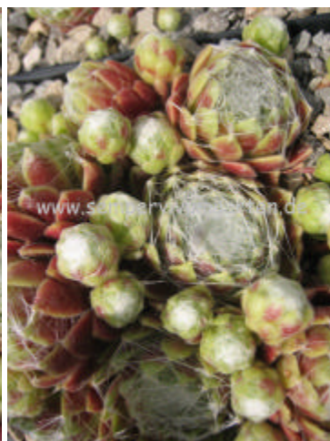
Sempervivum Zilver Kylie