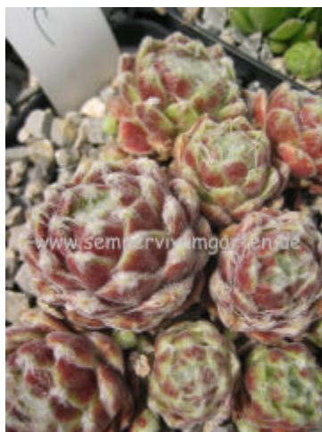
Sempervivum Zilver Olympic