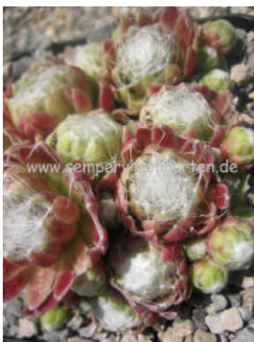
Sempervivum Zilver Suzanna