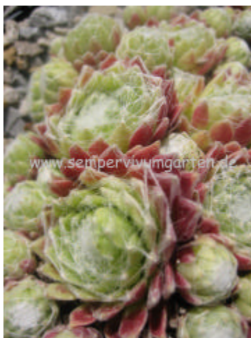
Sempervivum Zilver Joye

Ein mittelgroßer Hauswurz mit leichter Bespinnung. Die wüchsigen Pflanzen bilden ganz dichte Polster.