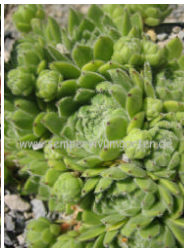
Sempervivum Zilver Reiger