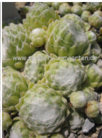
Sempervivum White Head