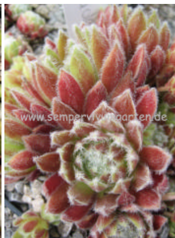
Sempervivum Zilver Masquerade