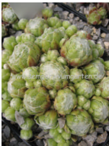
Sempervivum Zilver Meer