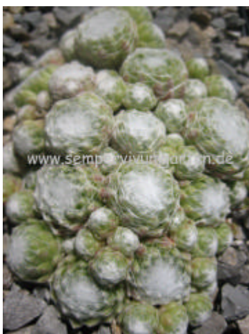
Sempervivum Zilver Rouge