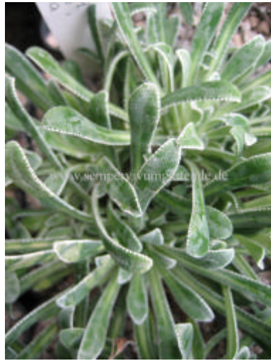
Saxifraga callosa 'Superba'