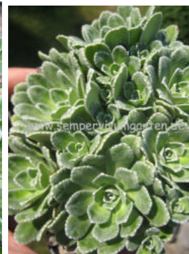
Saxifraga 'Kath Dryden'