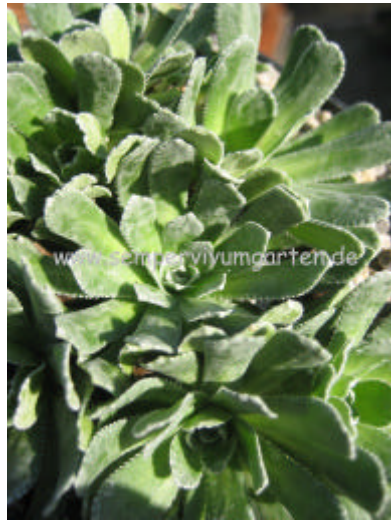
Saxifraga x 'Mary'