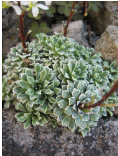
Saxifraga crustata 'La Brique'