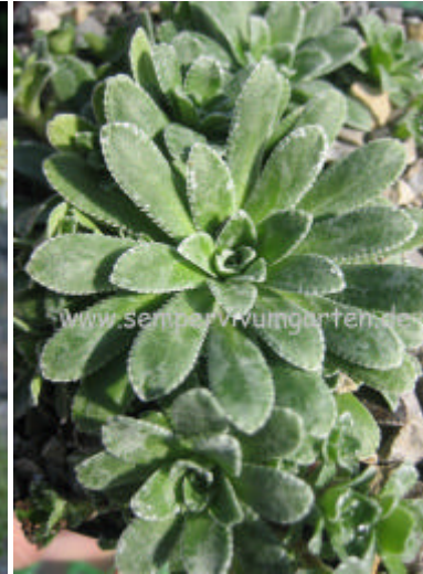
Saxifraga x 'Ori'