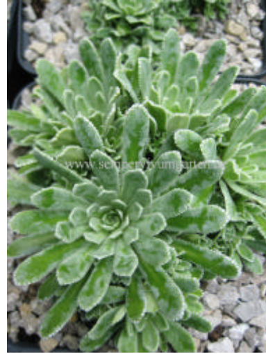
Saxifraga x churchillii