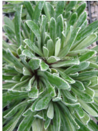
Saxifraga x engleri