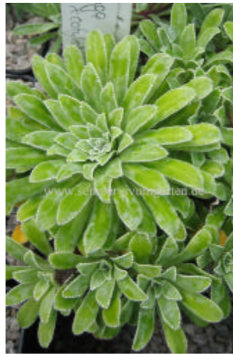
Saxifraga longifolia x cotyledon