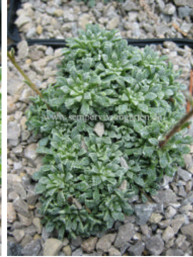
Saxifraga cochlaris 'Minor'