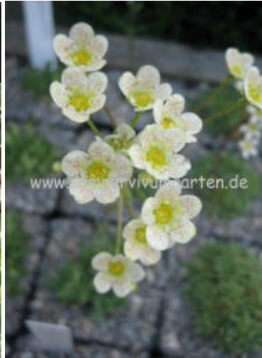
Saxifraga x 'Mary' Blüte