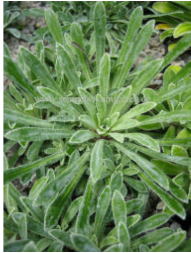
Saxifraga ,Walpole's Variety'