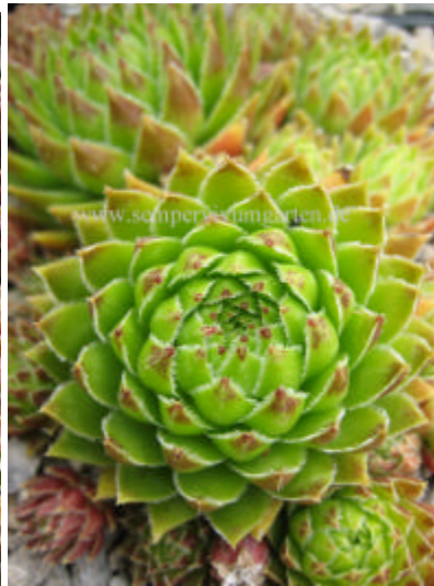
Jovibarba hirta White Knight