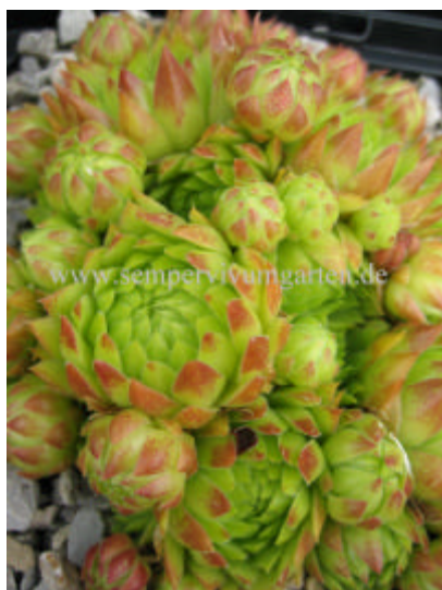
Jovibarba hirta Annenheim

O-Alpen, Karpaten, Ungarn, Dalmatien, Albanien. Die Rosetten sind mittelgroß, bis zu 6cm breit, zahlreiche Seitensprosse an kurzen, fadenförmigen Ausläufern. Blätter ganz grün oder an den Spitzen gerötet. Es gibt auch wenige blaugrüne Formen. Der Blütenstoss wird 15cm hoch, dicht beblättert. Der Blütenstand ist schopfig, vielblütig mit trichterförmigen blassgelb bis grünlichweißen Blüten.