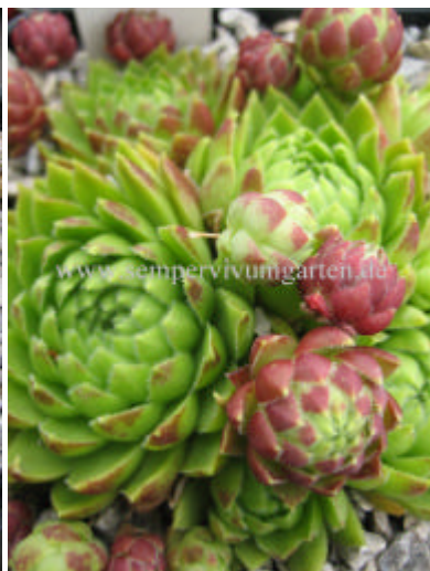
Jovibarba hirta v. Galgenberg