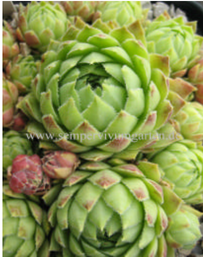
Jovibarba hirta Rax