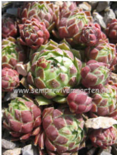
Jovibarba hirta Tally-Ho