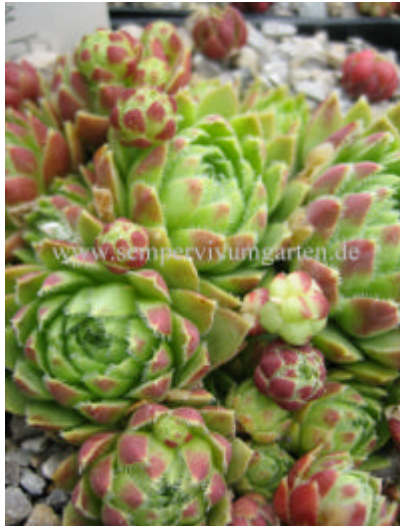
Jovibarba hirta v. Schwarzer Turm

hirta from Dunajec-Durchbruch/Pienniny/Slovakien Ahlm. 13 hirta from Eisenerzer Alpen RB 10 hirta from Falkenstein (A) hirta from Galgenberg (A) hirta from Giebhübel 500m (A) hirta from Gulsen 600m (A) hirta from Gulsen Berg (A) hirta from Hornad-Durchbruch/Slovenski Raj/Slovakien Ahlm.42