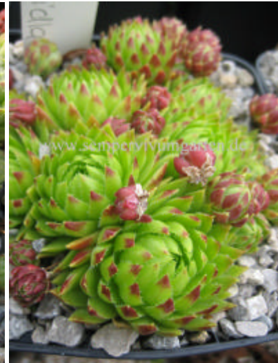
Jovibarba hirta Zdiarska Vidla

hirta from Hunsheimer Berg 500m (A) hirta from Kaning; Gr. Rosennock 2200m (A) hirta from Krems; Unterlioben 225m (A) Niederösterreich hirta from Linn hirta from Lucivna RB 66 hirta from Mala Fatra SK