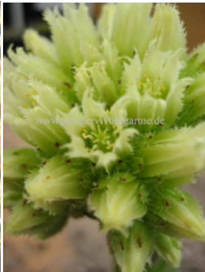
Jovibarba hirta Blüte