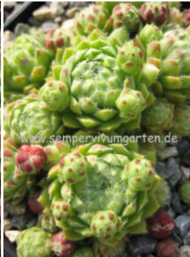
Jovibarba hirta Vollerin Hobe