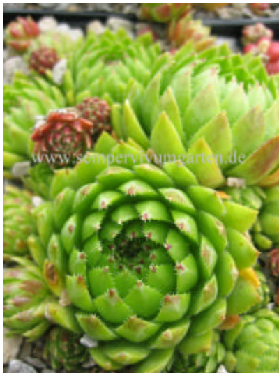
Jovibarba hirta Edward

hirta from Vollerin Hobe Xand A - Die Blattränder sind stark bewimpert!