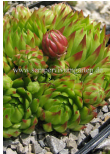
Jovibarba hirta ‚Baba Mare‘