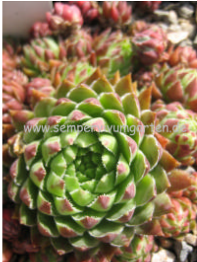
Jovibarba hirta Belaer Tatra

hirta from Aggtelek RB 10 hirta from Annenheim (A) Kanzelhohe 950m Karnten hirta from Anninger Ost 400m (A) hirta from Baba Mare