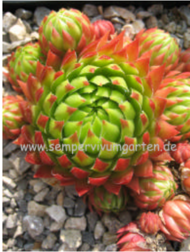
Jovibarba hirta Blutrot

hirta from Oberleiserberg Weinviertel 400m (A)