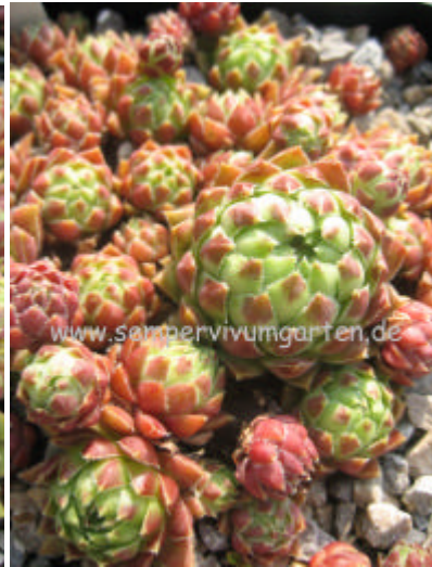
Jovibarba hirta Suzanna

hirta Hi-No-Mago Andre Smits B 2002 hirta Histoni hirta Josephine Andre Smits B 1996 hirta Knee-Hi Andre Smits B 2002 hirta Luca Andre Smits B 1990