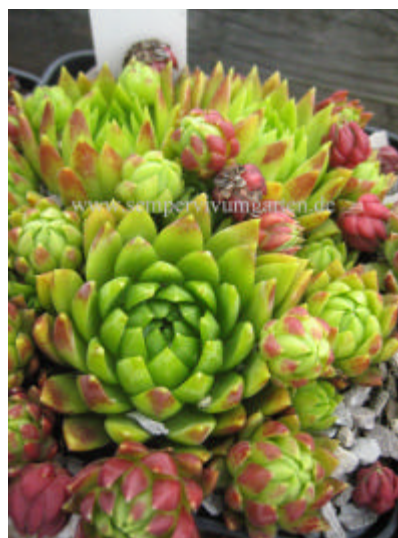
Jovibarba hirta Hystoni