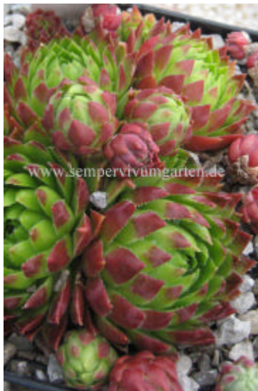
Jovibarba hirta Andreas

hirta from Hunsheimer Berg 500m (A) hirta from Kaning; Gr. Rosennock 2200m (A) hirta from Krems; Unterlioben 225m (A) Niederösterreich hirta from Linn hirta from Lucivna RB 66 hirta from Mala Fatra SK