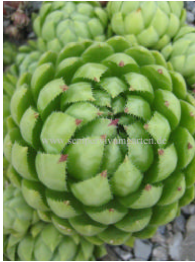
Jovibarba hirta Borealis