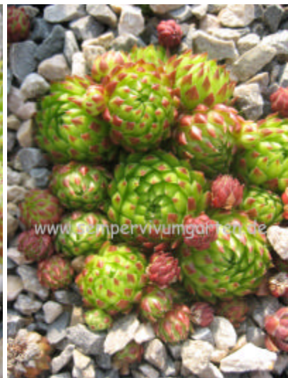
Jovibarba hirta Hedehog