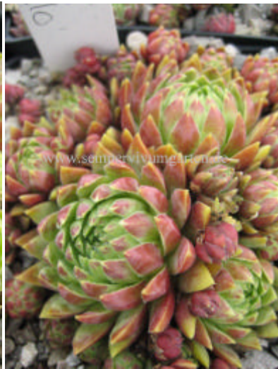
Jovibarba hirta Sodollo