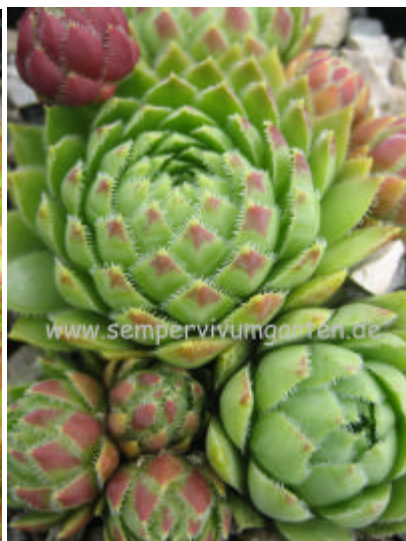
Jovibarba hirta ‚Anninger Ost‘