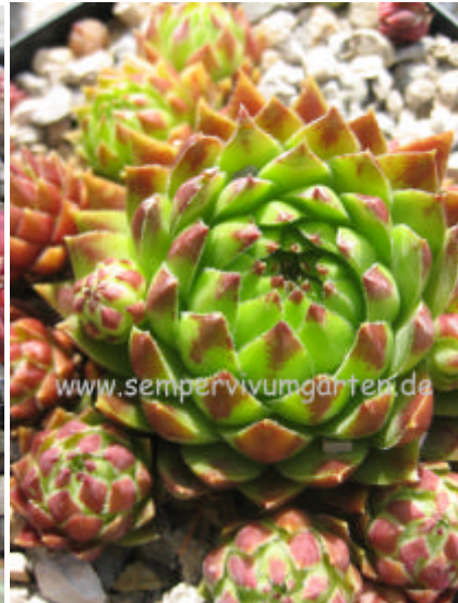
Jovibarba hirta Astrid