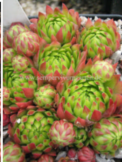
Jovibarba hirta Pascal