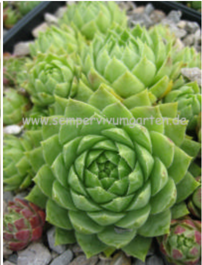
J. hirta Belianske Tatra bläuliche Form

hirta from Belaer Tatra hirta from Belianske Tatra (SK) grüne Form hirta from Belianske Tatra (SK) bläuliche Form hirta from Belko, Bukk Mts HO hirta from Besenova (SK) Hlinecky 1220 hirta from Budai Hegyek hirta from Budai Mts A HO hirta from Budai Mts B HO