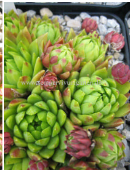
Jovibarba hirta Bernstein