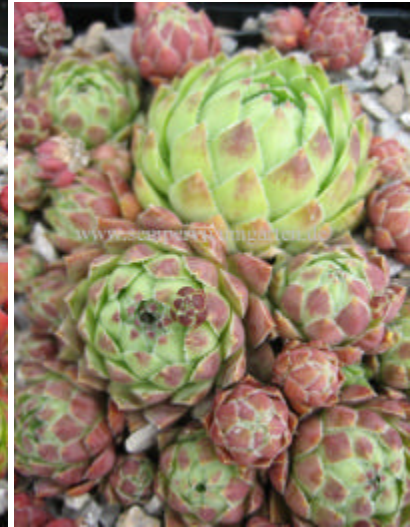
Jovibarba hirta Purple