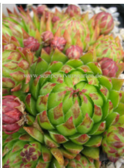
Jovibarba hirta Luca