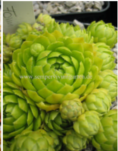
Jovibarba hirta Yellow Green Form