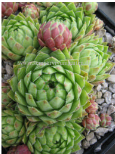
Jovibarba hirta Budai Mts B

hirta from Belaer Tatra hirta from Belianske Tatra (SK) grüne Form hirta from Belianske Tatra (SK) bläuliche Form hirta from Belko, Bukk Mts HO hirta from Besenova (SK) Hlinecky 1220 hirta from Budai Hegyek hirta from Budai Mts A HO hirta from Budai Mts B HO