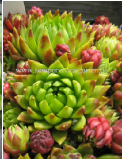
Jovibarba hirta Cokkie