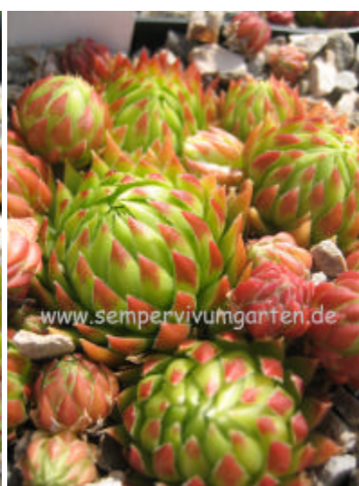
Jovibarba hirta Noordster