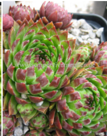
J. hirta v. Hornad-Durchbruch

hirta from Bulgarien hirta from Col D'Aubisque (F) Basses Rynenees hirta from Csiki Mts L Pasztor H