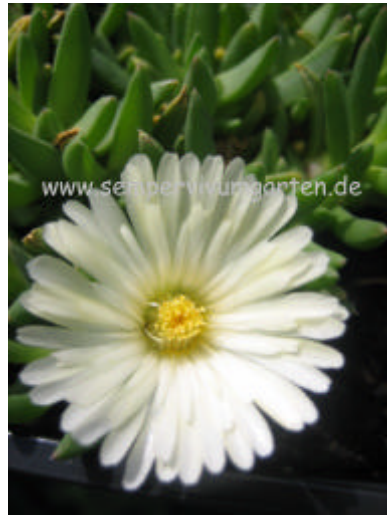
Delosperma ‚White Nugget‘