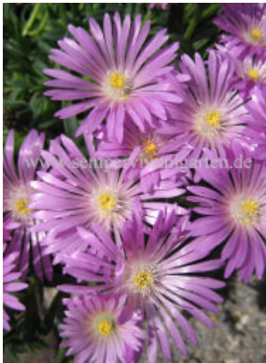
Delosperma ‚Pink Zulu’