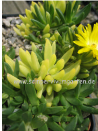
Delosperma 'Gold Diamond'