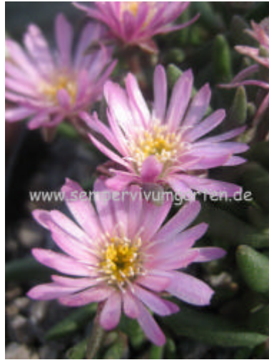
Delosperma 'Beauford West'