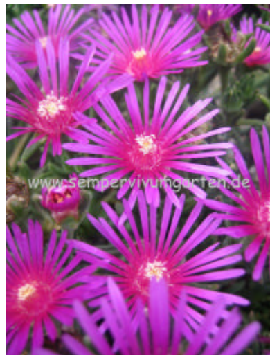
Delosperma cooperi 'Dwarf'