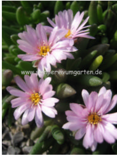
Delosperma 'Beauford Beauty'