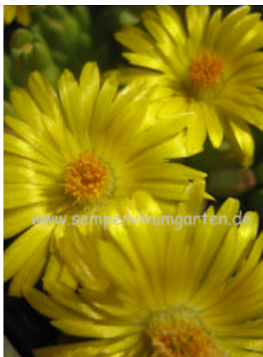
Delosperma nubigenum Sani Pass