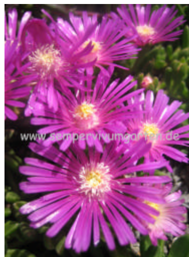
Delosperma ,John Proffitt'