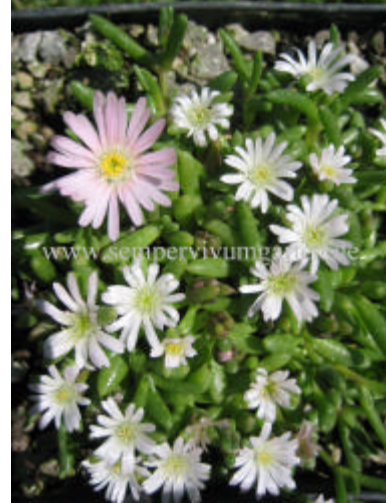
Delosperma 'Beauford Baby'