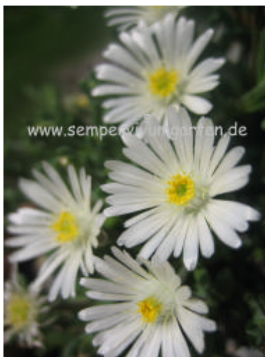
Delosperma ,Graaf Reinet'