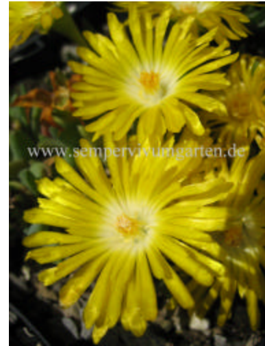
Delosperma 'Gold Nugget'