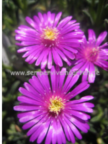
Delosperma ‚Morning Face’