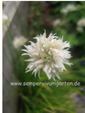
Allium 'Corsican White'