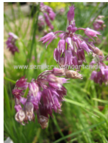
Allium cyathophorum var. farreri