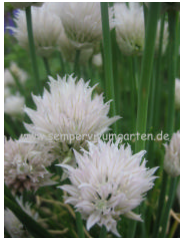
Allium schoenoprasum 'Album'