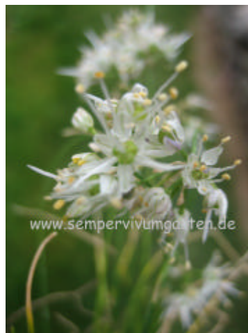
Allium cyaneum 'Album'