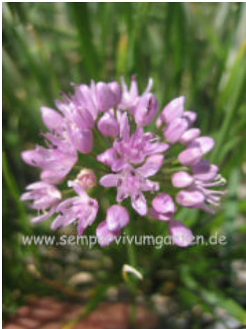
Allium tuberosum 'Iden Croft'