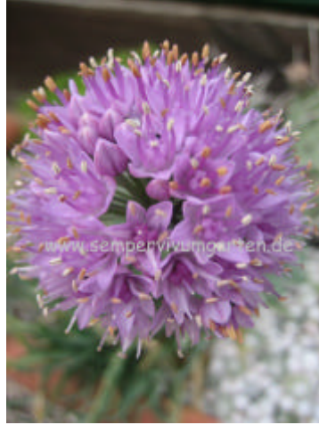
Allium senescens v. glaucum