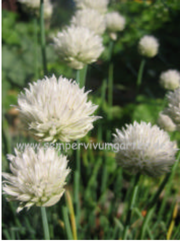
Allium 'Wallington White'